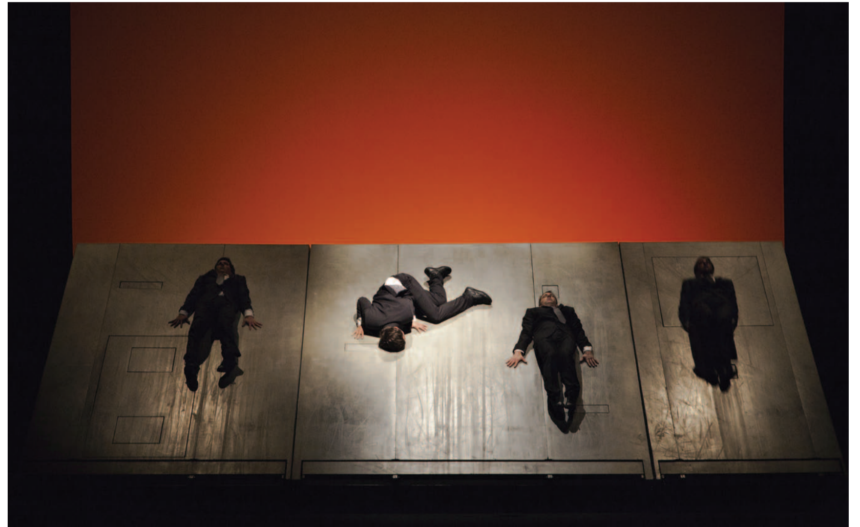
« Plan B »

par l'envie d'aborder l'actualité sous un angle de dérision générale : en frappant juste, mais en frappant un peu partout. Par moments, on voit surgir la farandole du coup de gueule, la suite bachique d'une colère qui risque de s'étouffer dans les gorges si on ne la vomit pas – exorcisme d'un mal que personne ne veut entendre. Dans un mouvement puissamment rythmé et timbré par la musique, la colère se meut en énergie pure et crache à la figure de tout le monde : à celle des bobos et de leurs « soupe aux orties et capotes en chanvre » ; à celle des petit(e)s vieux/vieilles qui ne croient plus au futur puisqu'ils n'y vivront plus ; à celle de l'Église qui se porte caution ; à celle des artistes et de leur statut d'assistés ; à celle des spectateurs(trices) et de leur bonne conscience. Au « combien voulez-vous ? » du « grand patron », les comédiens veulent répondre à arme égale. Par les mots. Par la vérité. Par l'émotion. Sur scène, tout le monde se trouve défait de son masque pour tenter, à son tour, de redonner au système un visage humain. De l'intime vers l'universel, la pièce brasse rage et dégoût mais aussi un amour profond. Un amour solidaire.