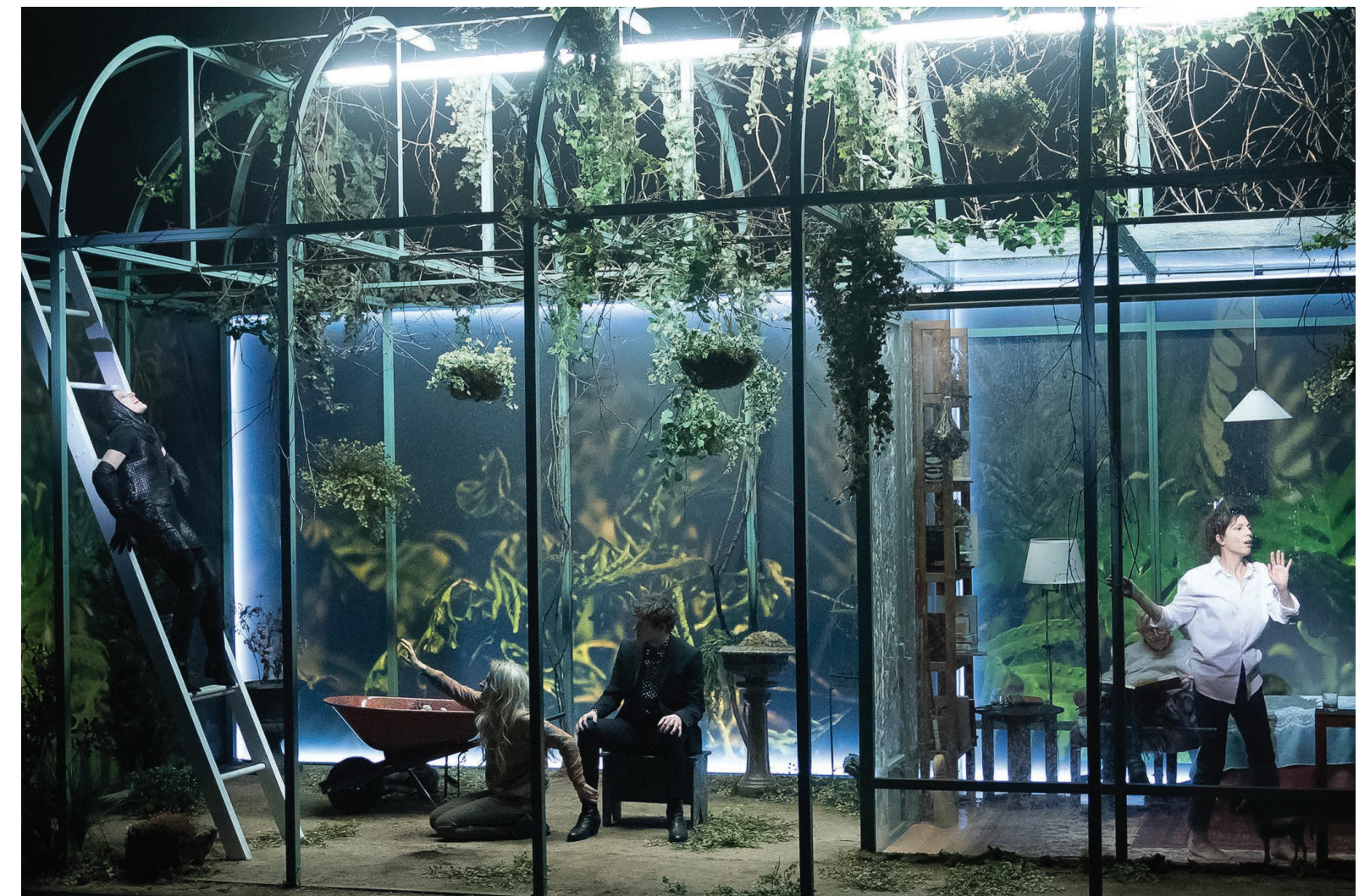
« La Vie utile » © Caroline Laberge

RES FACILES. LE SIROP LAISSE DES NAUSÉES.